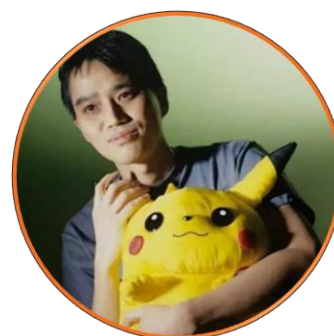
Сатоси Тадзири геймдизайнер, создатель «Покемона» аутизм