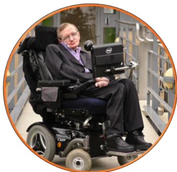
Стивен Хокинг ученый нарушение мобильности

В качестве примеров вы можете рассказать о людях, реализовавших себя в разных областях – науки, творчества и спорта.